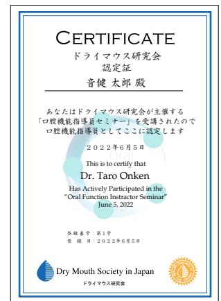
口腔機能指導員認定証サンプル